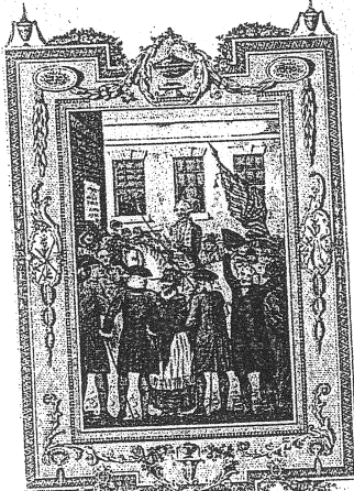
The manner in which the American Colonies declared themselves INDEPENDANT of the King of ENGLAND. Throughout the day, and the evening on July 4th 1776.

Engraving by R. B. H. in the American Museum of Natural History, 1820.